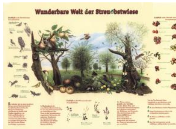
Beispiel Schautafel „Wunderbare Welt der Streuobstwiese“