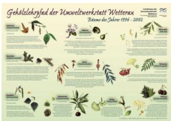
Schautafel 2: Bäume des Jahres 1996 - 2002

Auf dem benachbarten Lehrbiotop befinden sich neben einer Reihe interessanter Stationen fünf weitere Schautafeln mit Erläuterungen zur den Biotoptypen und Tierarten: „Wunderbare Welt der Streuobstwiese“, „Einheimische Fledermäuse“, „Solitärbienenarten“, „Benjeshecke“ und „Leben im Steinhäufen“.